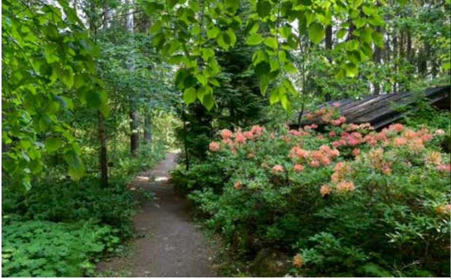
Valo leikittelee metsäpuutarhan kasvien lehdillä. Ylhäällä on vuorijalavan lehtiä. Lohenpunaisena kukkivan japaninatsalean lisäksi polun varrella on aluskasvillisuutena tuoksukurjenpolvea.