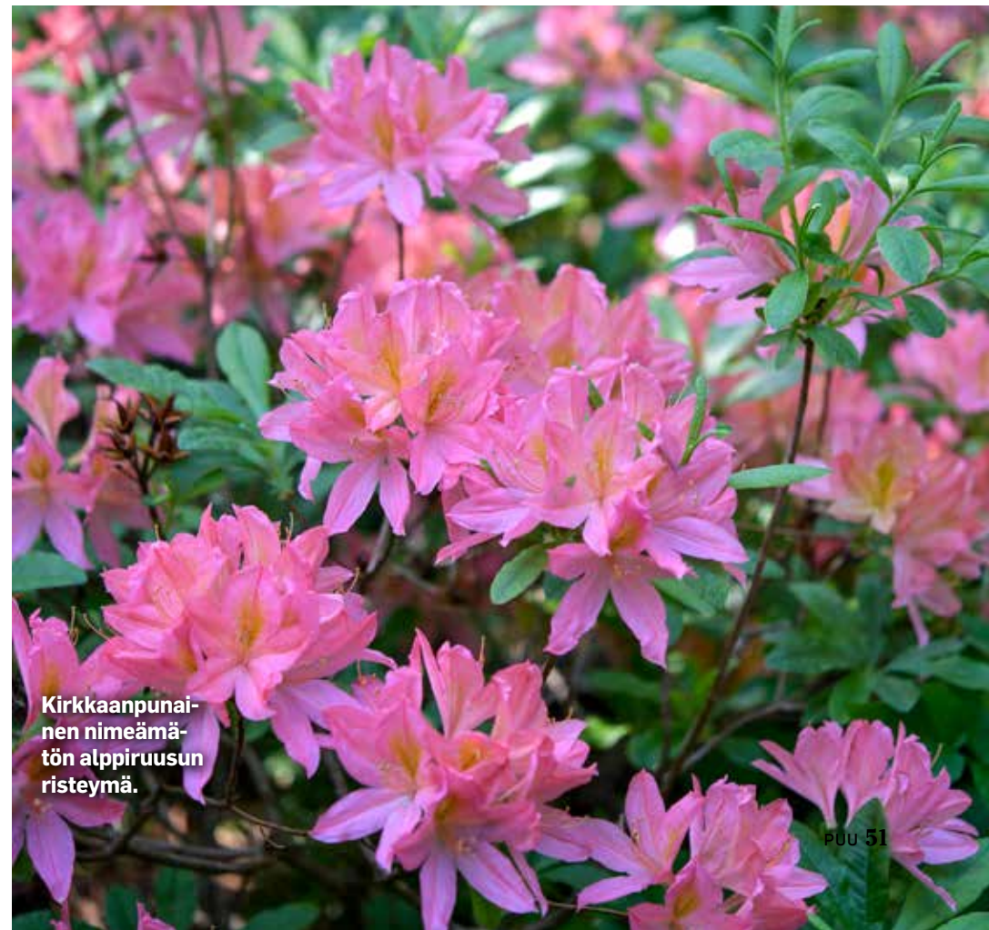
Kirkkaanpunainen nimeämätön alppiruusun risteymä.