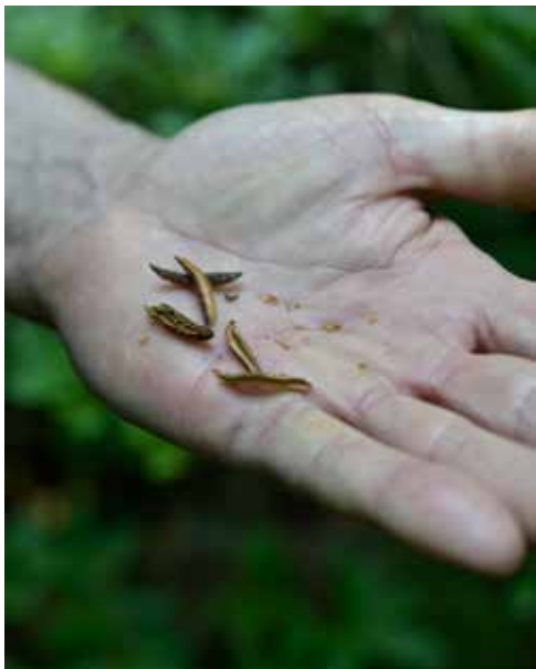
Alppiruusujen pikkuruiset siemenet kypsyvät lokamarraskuussa.