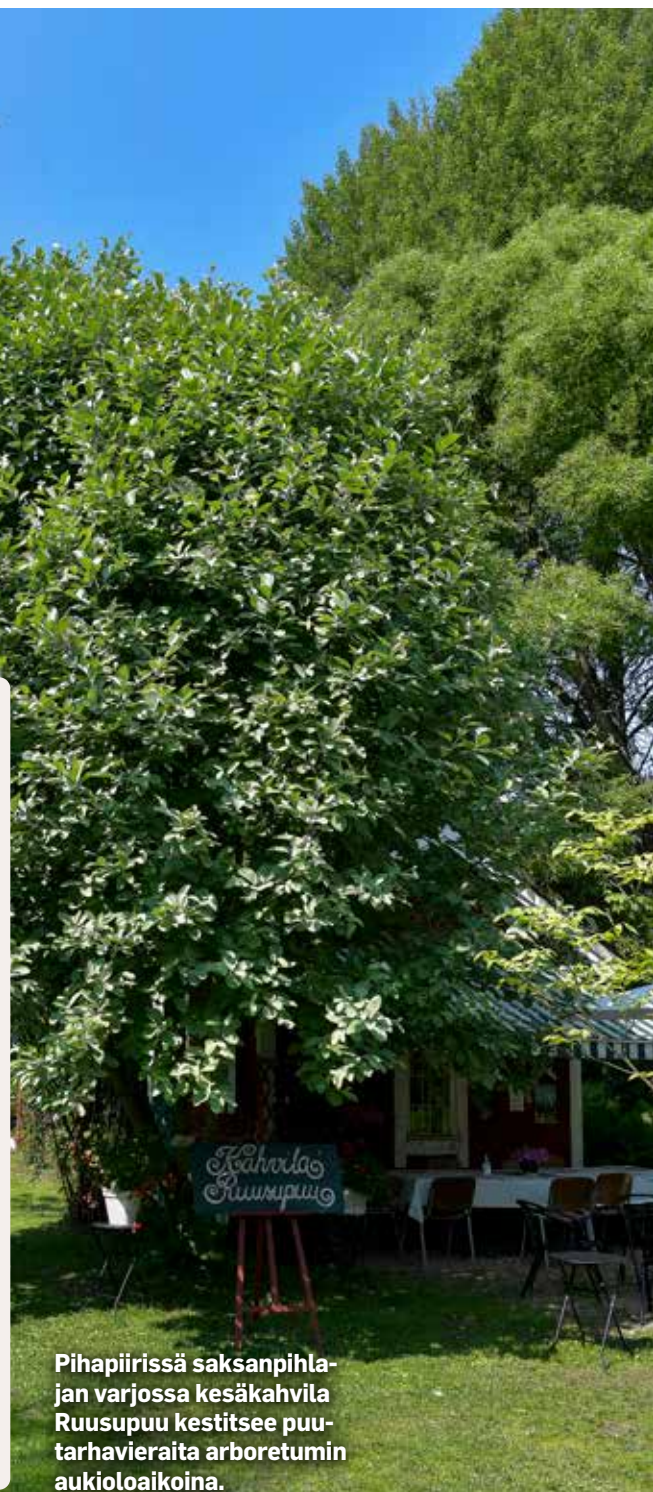
Pihapiirissä saksanpihlajan varjossa kesäkahvila Ruusupu kestittää puutarhavieraita arboretumin aukioloaikoina.

Mitä uutta on tiedossa kesälle 2024? ”Kokonaan uusi atsalea- ja alppiruusualue omista siementaimista sekä lisää aukiolopäiviä puiston parhaaseen kukinta-aikaan kesäheinäkuussa.”