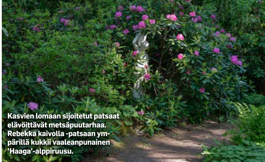
Kasvien lomaan sijoitetut patsaat elävöittävät metsäpuutarhaa. Rebekka kaivolla -patsaan ympärillä kukkii vaaleanpunainen 'Haaga'-alppiruusu.