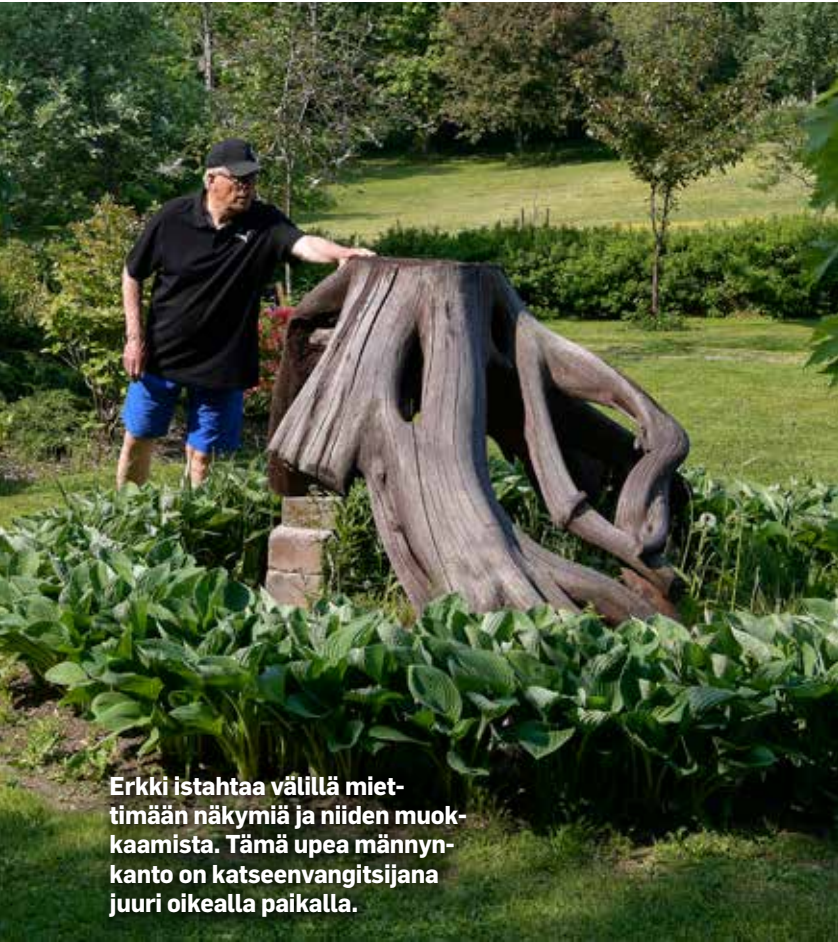
Erkki istahtaa välillä miettimään näkymiä ja niiden muokkaamista. Tämä upea männynkanto on katseenvangitsijana juuri oikealla paikalla.