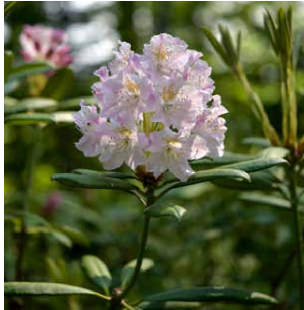
Alppiruusu 'Mikkelin' kukat ovat hennon punertavia.