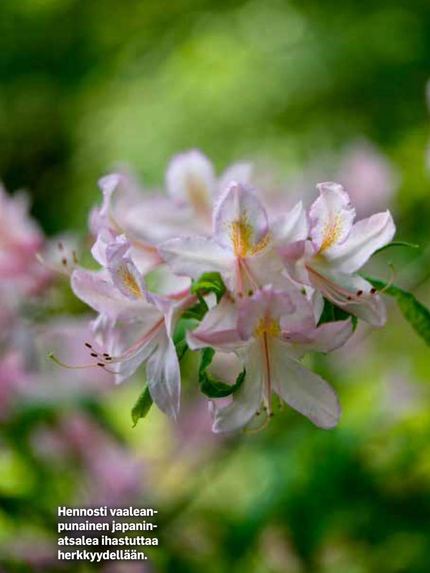
Hennosti vaaleanpunainen japaninatsalea ihastuttaa herkkyydellään.